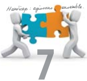
Handicap : agir ensemble.