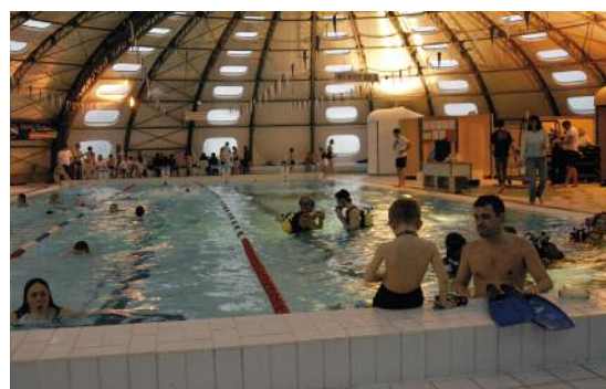
Cette soirée fut également ludique, puisque de nombreux jeux aquatiques étaient proposés.