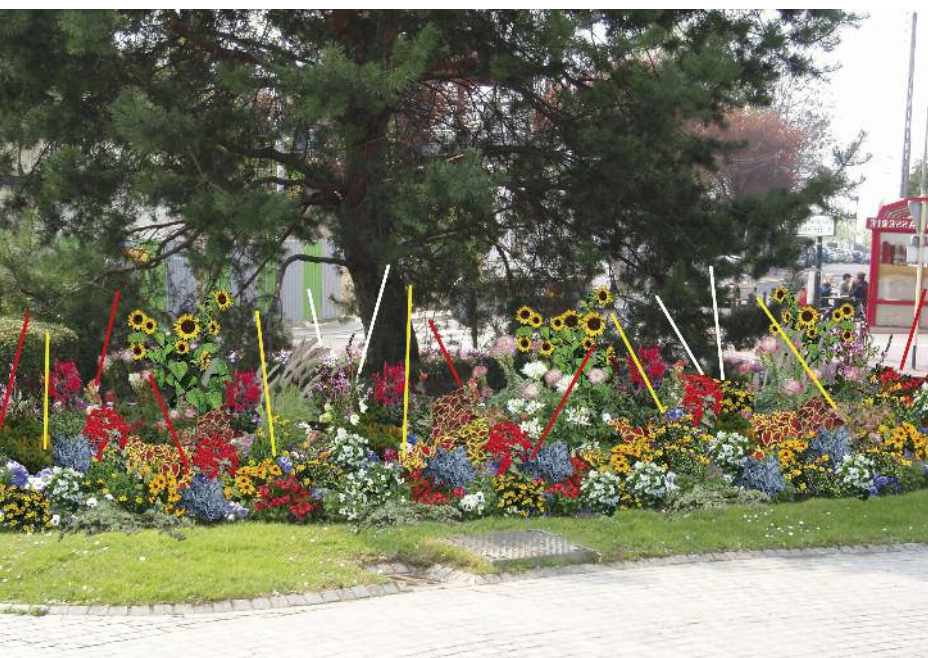
Le fleurissement 2011 met le jaune à l'honneur dans tous les massifs de la ville.

Les massifs seront également fleuris de dahlias et de cannas, tubercules qui assurent un verdissement et une floraison tout l'été. Le Service municipal Espaces Verts les réutilise chaque année. D'autres fleurs, telles que les glaïeuls, les lys... fleuriront pour le plaisir de tous et seront plantées pendant plusieurs été. À l'automne, elles seront nettoyées, stockées et attendront patiemment la belle saison.