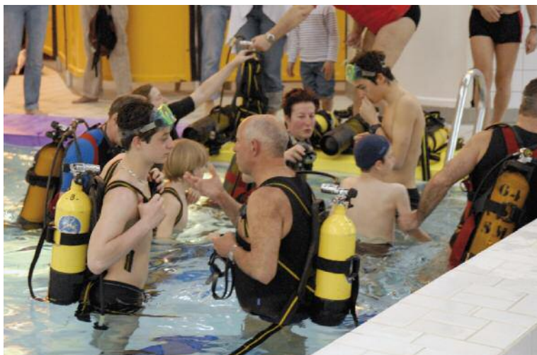
Les participants ont également pu s'initier à la plongée sous-marine grâce aux baptêmes mis en place par le club Les Amis de la plongée sous-marine (APSM). Après cette première expérience concluante, petits et grands pourront ainsi se laisser tenter et découvrir les fonds marins.