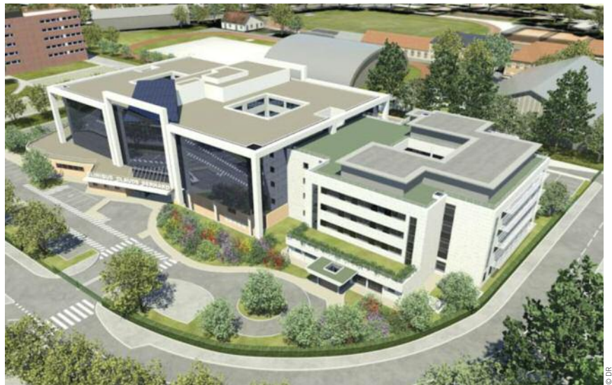
Pendant les travaux, pensez au Parking d'intérêt régional, situé près de la gare Ermont Eaubonne.

Attention, ce chantier est strictement interdit au public.