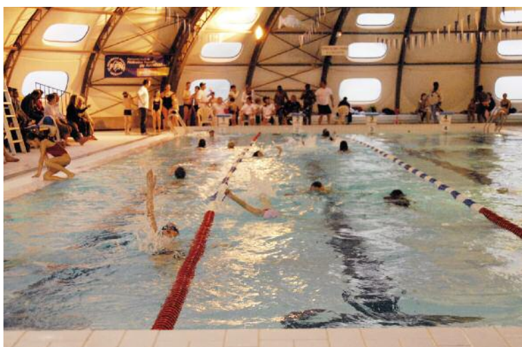
Adultes et enfants se sont « confrontés » lors du challenge de natation.

DANS LE CADRE DU PARTENARIAT AVEC L'UNICEF ET VILLE AMIE DES ENFANTS ET LE CLUB DE NATATION SYNCHRONISÉE, LA MUNICIPALITÉ D'ERMONT A ORGANISÉ UNE NOUVELLE NUIT DE L'EAU À LA PISCINE MUNICIPALE MARCELLIN-BERTHELOT, SAMEDI 2 AVRIL DERNIER. CETTE OPÉRATION CARITATIVE À LAQUELLE 550 PERSONNES ONT PARTICIPÉ, VISANT À SENSIBILISER CHACUN À LA NÉCESSITÉ DE RESPECTER L'EAU COMME RESSOURCE ESSENTIELLE, A PERMIS DE COLLECTER PRÈS DE 1 000 €.