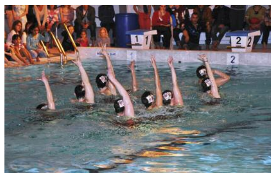
Pour clore cette soirée en beauté, Ermont natation artistique (ENA) a présenté son spectacle de ballets nautiques ; un spectacle qui a ravi tous les spectateurs.