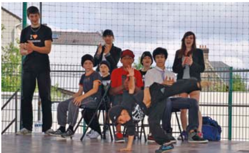
Démonstrations des ateliers de la Direction de la Jeunesse et des Sports lors de la journée portes ouvertes du 23 juin dernier.

Cette année, les jeunes qui le souhaitent peuvent postuler jusqu'à mi-octobre pour débiter leur service civique en novembre. En 2011/2012, deux actions ont été mises en place à Ermont avec une équipe de