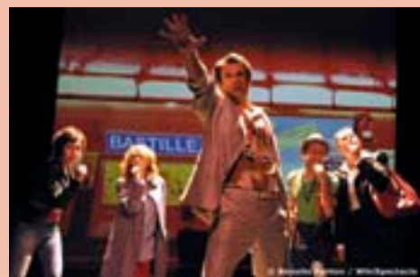
Sur une mise en scène originale et inventive de Pascal Légitimis, Métronome est une performance vocal a capella du quintet Cinq de cœur.