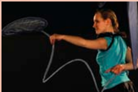
Petit Mars changeant est une installation spécialement conçue pour les enfants en bas âge (dès 1 jour !) dans laquelle les petits et leurs accompagnateurs s'installent sur un tapis moelleux en compagnie d'une danseuse.