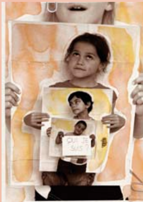
Le spectacle Comment moi je , création de la Cie Tourneboulé, parle aux enfants de philosophie en les interrogeant sur le MOI et leur identité. Ce spectacle sera l'occasion d'initier des ateliers philo pour les plus jeunes. À voir dès 5 ans.