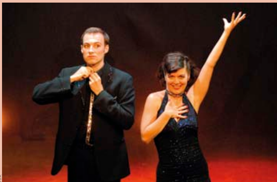
L'envers du décor entremêle une comédie sentimentale finement troussée et une savoureuse évocation de l'opérette à l'ancienne et de « tubes ».