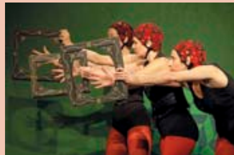
En avril, les enfants dès l'âge de 3 ans pourront découvrir l'univers décalé et onirique du merveilleux du Cirque à 3 pattes .

La saison théâtrale en direction du jeune public est un des éléments essentiels de la politique culturelle menée par la Municipalité. Afin de participer pleinement au développement de chaque enfant et d'aiguiser son sens critique, le Pôle Culturel propose un ensemble de formes artistiques s'accompagnant de diverses actions culturelles : les rencontres avec les auteurs et metteurs en scène, les lectures publiques... Au même titre, cette saison, les actions en milieu scolaire englobent diverses offres : ateliers d'éveil artistiques, activités autour du cinéma, autour de la musique avec notamment la création d'une fanfare périscolaire qui fera ses débuts cette saison... Les projets issus des Centres socio-culturels et de la Médiathèque intercommunale André-Malraux font aussi partie de ce « parcours culturel et artistique » qui permet à l'enfant, à ses parents et aux enseignants de profiter de propositions globales et cohérentes.