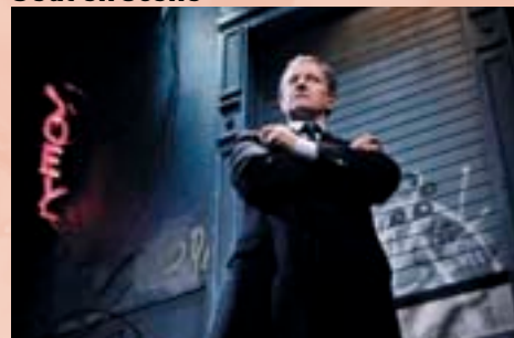
Dans Bronx , seul sur scène, Francis Huster campe avec sincérité et générosité les 18 personnages de ce récit de Chaz Palminteri.