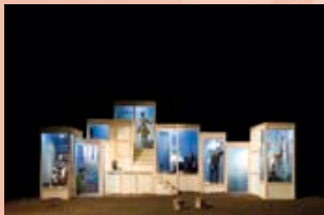
La pièce de Marivaux, La seconde surprise de l'amour , sonde le mystère du sentiment amoureux.