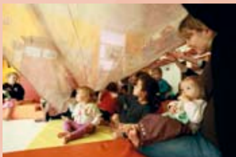
En octobre, Piccoli Tempi s'adressera aux enfants dès l'âge de trois mois dans les crèches de la ville.