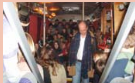
Dans TAM , vous serez accueilli... dans un bus dans lequel on vous racontera une histoire d'amitié enfantine avec ses joies et ses larmes. Le bus pourra rouler de lieu en lieu. À voir à partir de 7 ans.